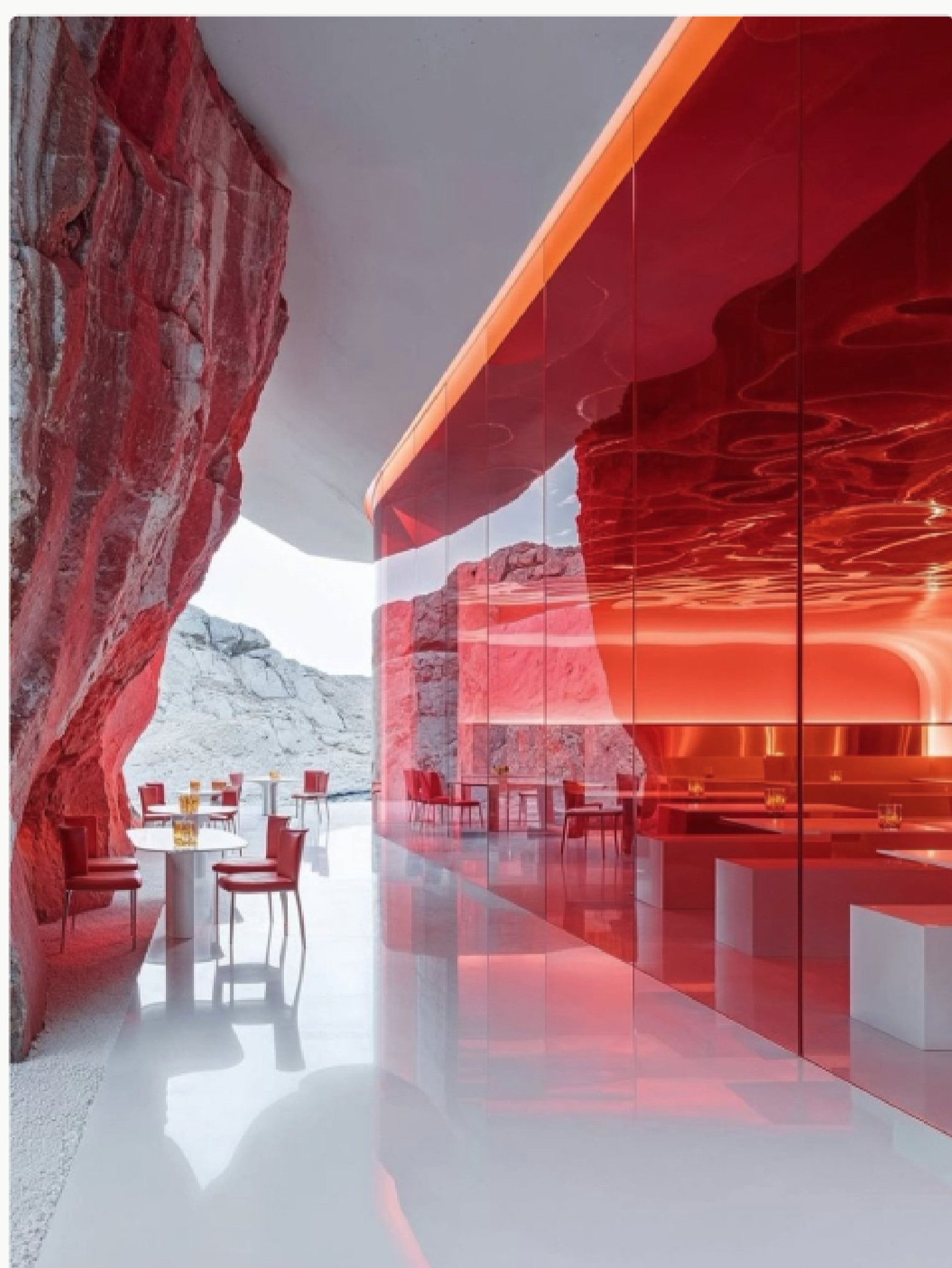
Le Silence Blanc