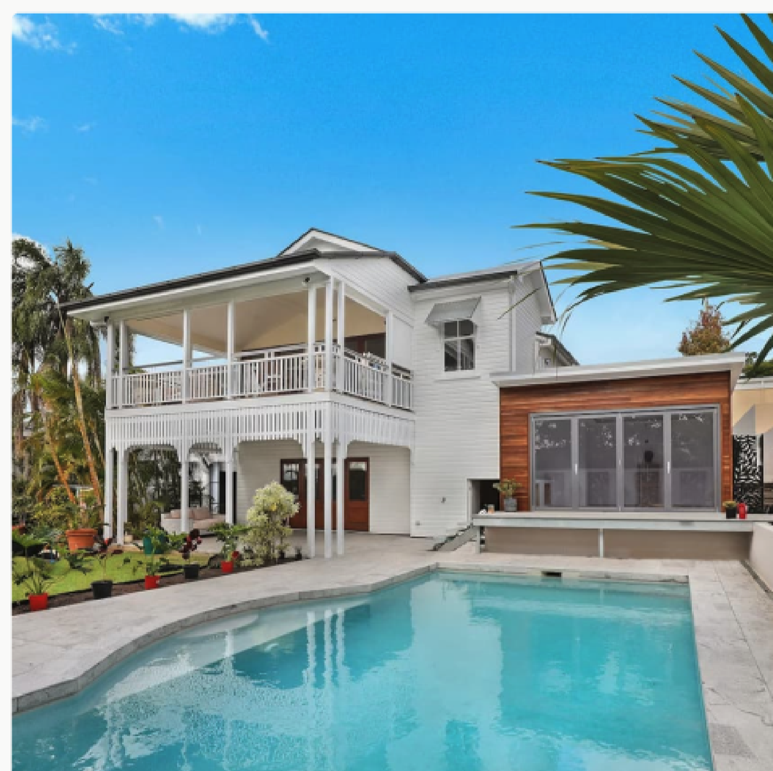
L'Or de Toscane

Vue à 360° sur les toits de zinc. Un refuge suspendu hors du temps, au cœur battant de la ville lumière.