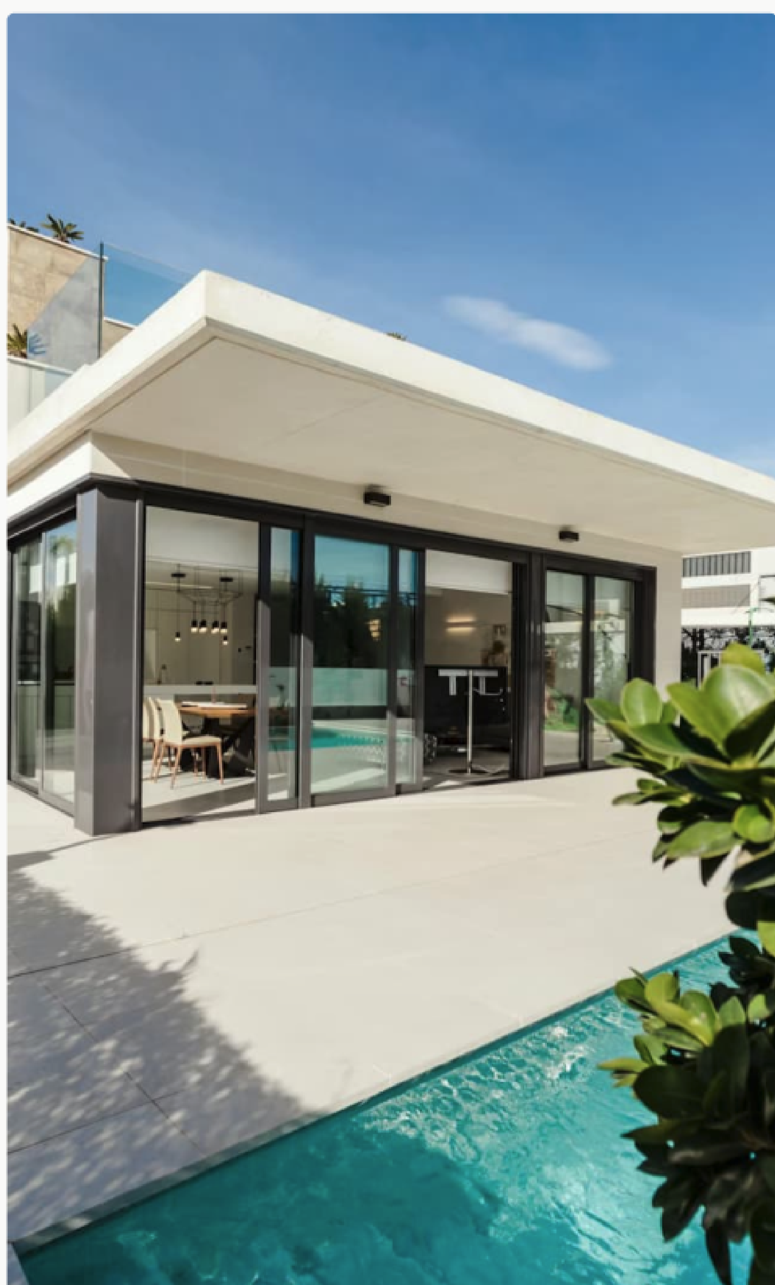
Ciel de Paris