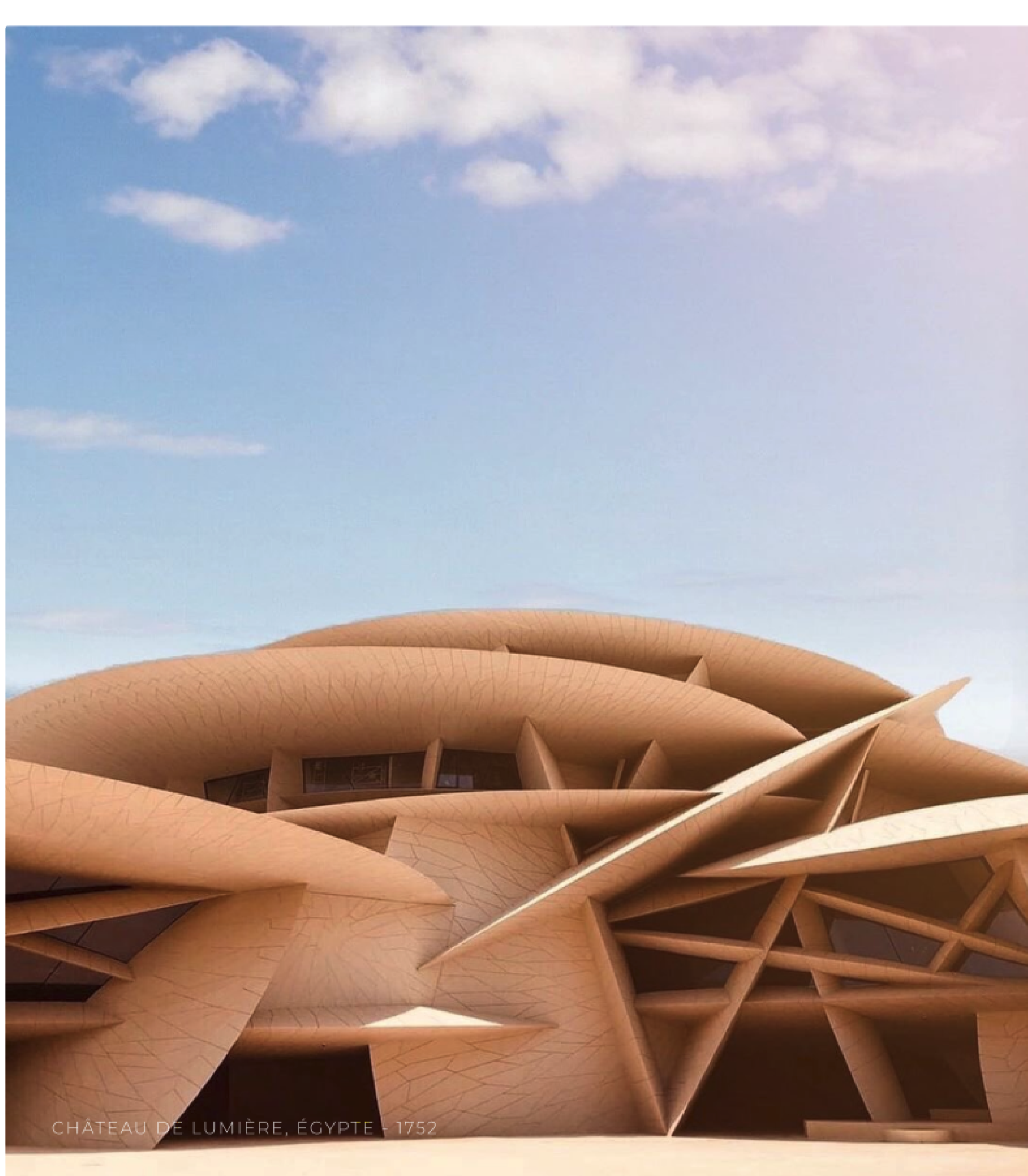
CHATEAU DE LUMIÈRE, ÉGYPTE | 1752